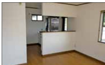
◀人気の対面キッチン