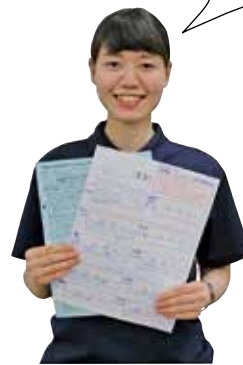
健康長寿課 保健師