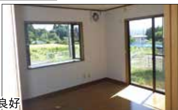
▶日当たりも、眺めも良好

申し込み＝10月1日（木）から30日（金）までに、申込書を直接、群馬県住宅供給公社桐生支所（市役所4階）または黒保根支所地域振興整備課へ。募集案内と申込用紙は、同公社、新里・黒保根支所にあります。