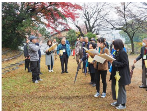
第1回ワークショップ(現地見学)の様子