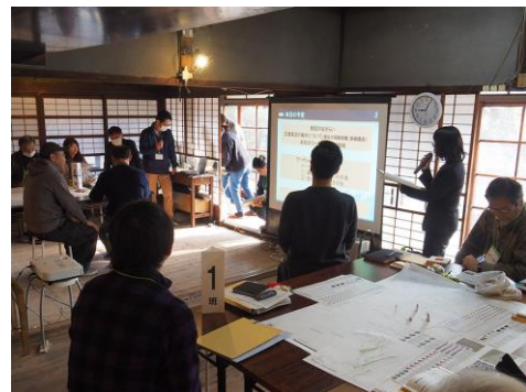
第3回ワークショップの様子

なお、今後も地域の皆様にお伝えするためのニュースレターを適宜発行し、ワークショップについても整備の進捗状況に応じて開催を予定していきます。