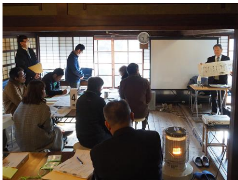
第2回ワークショップ(歴史まちづくり講演会)の様子