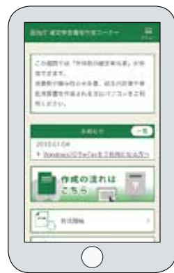
スマホ専用画面イメージ

スマホ専用画面は、スマホやタブレットでも画面が見やすく、操作しやすくなっています。令和2年分の確定申告では、感染防止の観点からも、ぜひご自宅からスマホ申告をご利用ください。