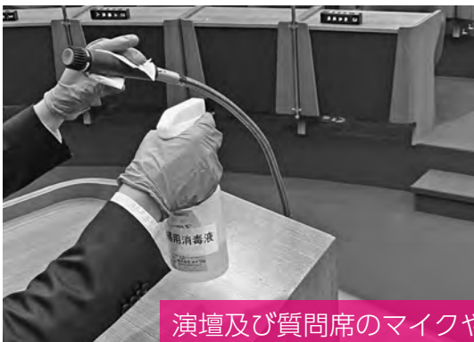
演壇及び質問席のマイクや机等、手に触れる部分を人が変わるごとに消毒

令和2年5月の第1回臨時会より実施してきました、新型コロナウイルス対策に加え、今定例会では、新たに新型コロナウイルス感染拡大防止対策を講じました。