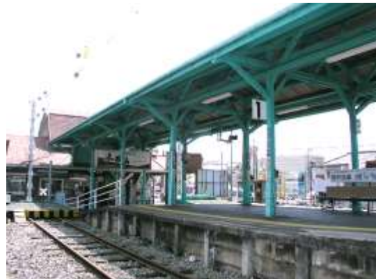
プラットホーム上屋