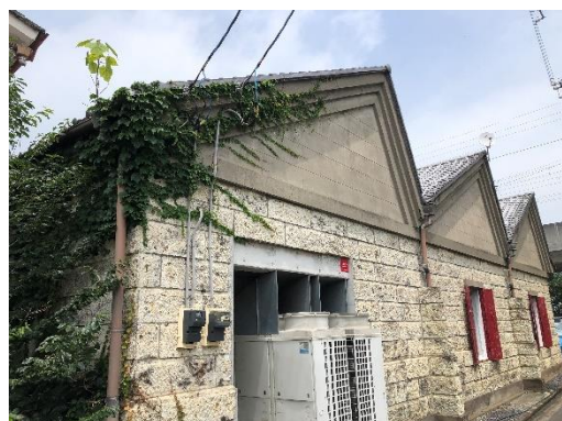
建物外観（正面入り口反対側から撮影）