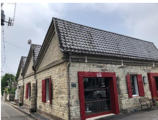
建物外観（正面入り口側から撮影）