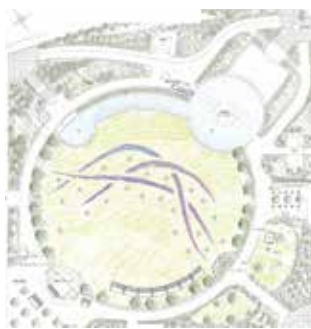
メイン会場の花壇イメージ

市の花であるサルビアをはじめ、市内で生産されたアジサイなども用いる予定で、華やかに会場を彩ります。