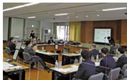
「挑戦」桐生工業高校生徒の庁舎設計提案