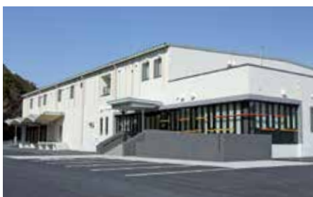
「前進」新学校給食中央共同調理場