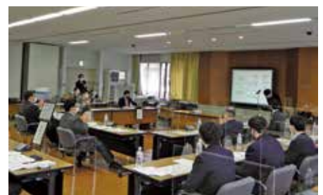
「挑戦」桐生工業高校生徒の庁舎設計提案