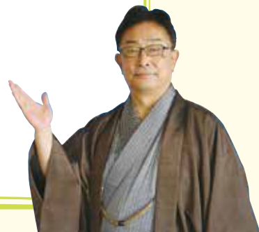
桐生市長 荒木 恵司