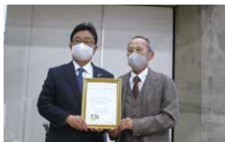
「創造」ゆっくりリズム宣言