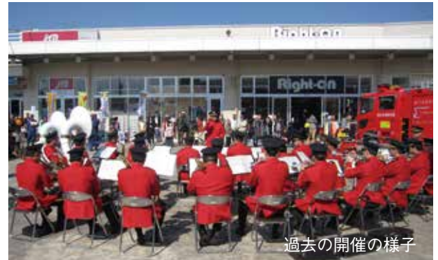
過去の開催の様子

市制施行100周年・水道創設90周年の記念事業として、消防フェスタを開催します。