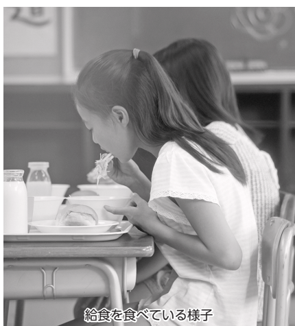
給食を食べている様子

問 現在のコロナ禍での学校給食については、感染拡大防止の観点から児童・生徒は前を向き黙食していると聞いている。本来給食はみんなで楽しく食べるものと考え、コロナ禍でも給食の時間を楽しく過ごせる方法について当局の見解は。 答 現在、楽しく会話をしながらの食事ができないため、ストレスを感じている児童・生徒がいるものと推察される。感染対策としての黙食は変更できないが、各校では、行事のDVDを放映したり、音楽を放送したりと工夫を凝らし少しでも雰囲気明るくなるような取り組みをしているとの報告を受けている。