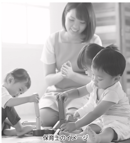
保育士のイメージ

問 子供一人一人の理解を深める保育の確立のため、公定価格が定める基準以上の保育士の加配が余儀なくされている。その中で、非正規雇用の方々の負担が大き。市としても保育士の加配や処遇改善に対して援助していく必要があると思うが、当局の見解は。 答 保育士の加配が必要な状況であれば、まずは公定価格の中で国が対策をとるべきものと考え。市としては各施設において、公定価格の加算を有効に受けられるような事務的支援を行っている。公定価格改定の声があれば、市としても県等と協議をしながら要望したい。