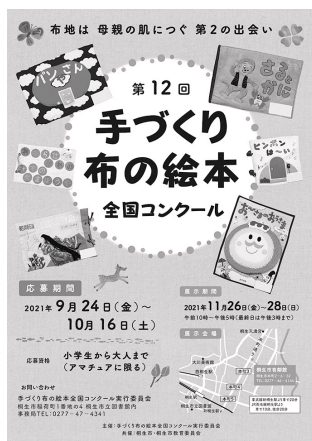
第12回手づくり布の絵本全国コンクールポスター

また、運営については、地元の企業や個人の皆様に協力をいただき、協賛金や寄附金を募るなどして運営費用に充てている。