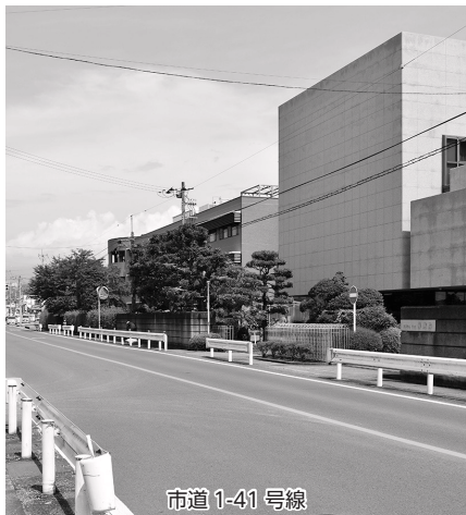
市道 1-41 号線

問 岸病院から相生交番前信号を渡り、駐車場までのルートは約175mあり遠い。病院には不特定多数の方々が、最短距離で市道を横断している状況である。岸病院前の市道1-41号線は、交通量も多く、非常に危険であるため、横断歩道又は歩行者用信号機を設置できないか。 桐生警察署と協議していききたい 答 岸病院前の市道については、交通量も多く、市としても危険箇所と認識している。越後屋酒店前の横断歩道を岸病院寄りに移動できないか桐生警察署に要望しているところである。今後とも交通事故のない社会を目指し、桐生警察署と協議していききたい。