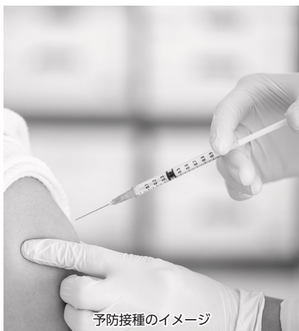
予防接種のイメージ

問 ワクチン接種は強制か。任意なら事実上の強制接種にならないための方策をしっかりと打っていただきたい。打たない選択をした人が集団の中で不利益な取り扱いを受けないための方策は。 強制ではなく任意 答 新型コロナウイルスの接種は、強制ではなく、個人の判断により接種を受けるか否かを任意により選択できるものである。コロナに限らず、差別することなどはあってはならないこと。そうした風潮にならないよう市民の理解がいただけるよう努めていきたい。なお、これらの周知はすでに市ホームページに掲載している。