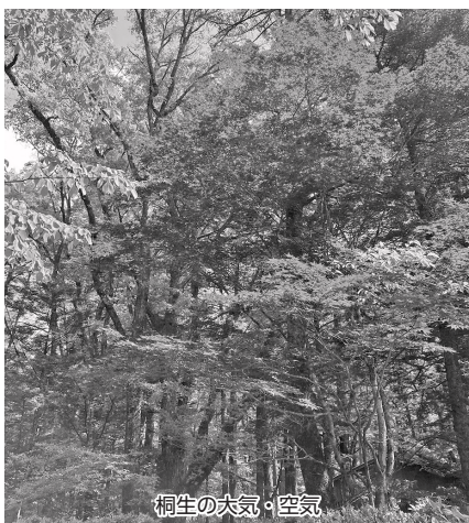
桐生の大気・空気

問 県は1時間毎の大気汚染物質の測定値を公開しており、市は光化学オキシダント注意報等が発令された場合、ふれあいメールで周知をしている。AQI値に基づく観測・予測値は現在、日本国内では指標として扱っていないが、「わかりやすい」大気・空気情報の市民向け発信については、今後も群馬県と連携を図りながら研究していきたい。