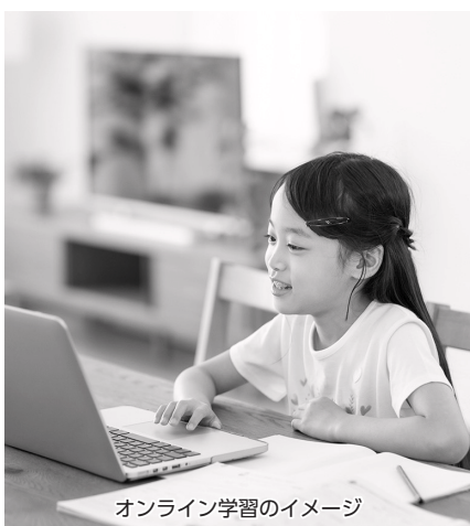
オンライン学習のイメージ

問 学習状況の把握や、学校全体での組織的で継続的な対面指導のあり方など、出席扱いとする基準を整備する必要があるが、不登校児童生徒にとって学校復帰や社会復帰のきっかけとなるよう研究していきたい。