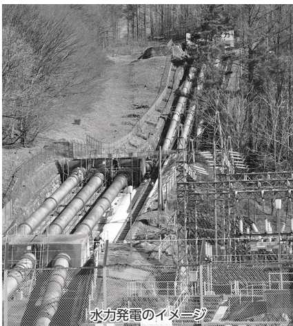
水力発電のイメージ

また、平成30年6月に策定した水道事業経営戦略の中で、官民連携の推進について掲げており、PFI事業についても官民連携の手法の一つとして検討していくこととしている。小水力発電をPFI事業として実施する可能性についても、水道事業の附帯事業として実施できるかどうか、今後研究してまいりたい。