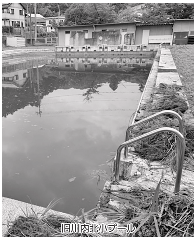
旧川内北小プール

答 現在プールに溜まった水について、当時のままの設備で排水が可能か調査しているが、設備の劣化による排水装置の一部欠損などにより、排水できない可能性もあるため、ポンプを使用しての排水も視野に入れながら具体的な方法を検討している。こういった方法で対応が可能か、早急に検証し対応していきたい。