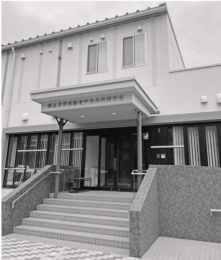
新学校給食中央共同調理場