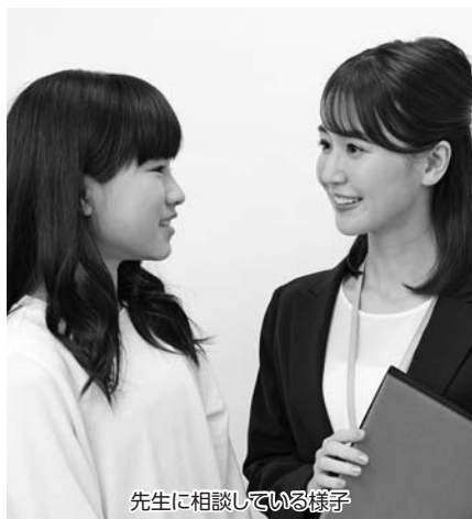
先生に相談している様子