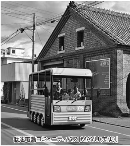
低速電動コミュニティバス「MAYU(まゆ)」

問 群馬大学など産学官民が一体となり科学技術イノベーションを活用した地域課題解決に向けた文部科学省事業に参加し、次世代モビリティの実証実験を行ったが令和2年度の結果は、 答 低速電動バスの運行に関しては、地域の理解と合意、運行主体の形成、道路環境の技術的な研究などの課題が抽出された。そうした中、低速電動バスを公共交通の導入しないエリアまで運行することで高齢者に買い物機会を提供するイベントでは多くの市民が参加した。今後も公共交通の補完を目指し、産学官民が一体となって推進していきたい。