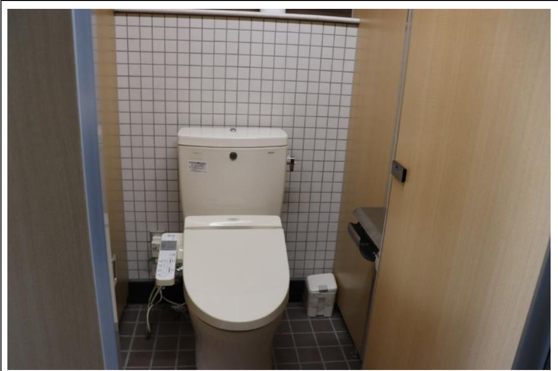
バリアフリースイイレ