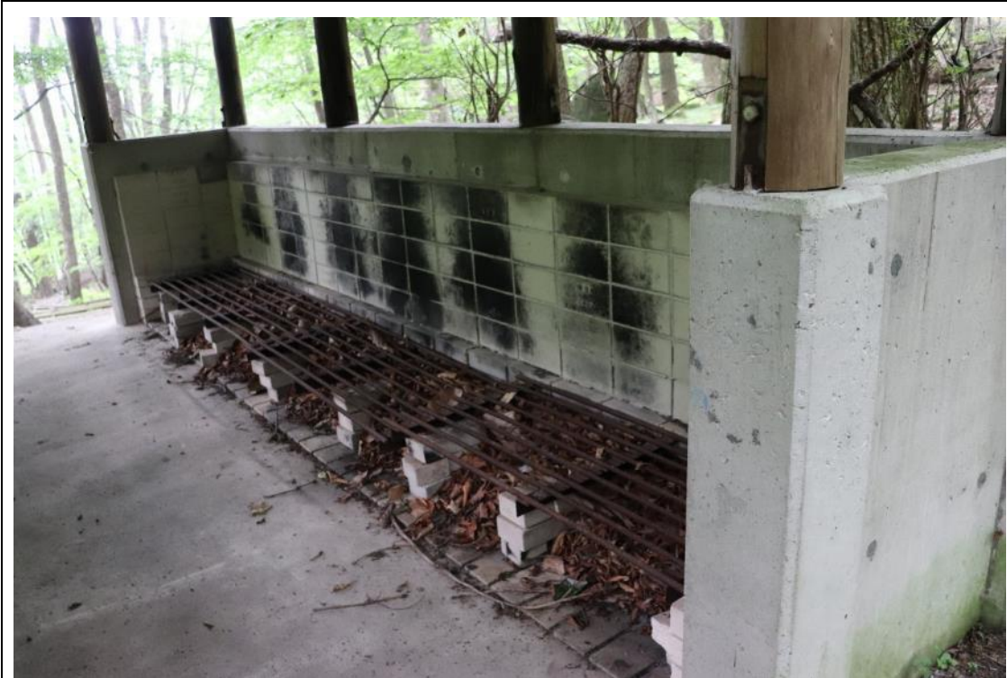
炊事場(バンガローエリア)