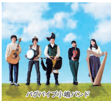
パガパイプ小嶋バンド

期日 10月8日（金） 時間 午前11時30分開演 場所 美喜仁桐生文化会館シルクホール 費用 全席自由500円