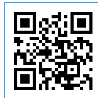
国際センター公式 Twitter