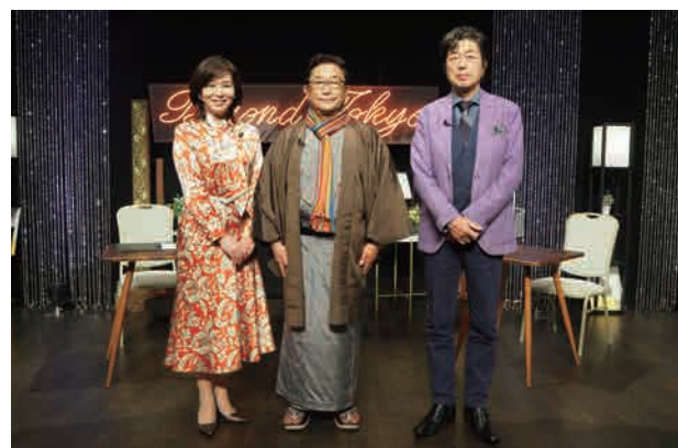
▲収録スタジオにて