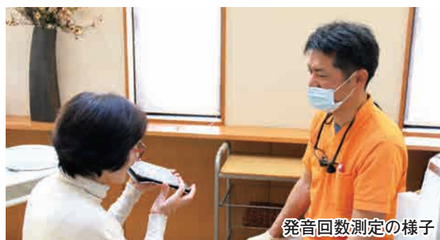
発音回数測定の様子