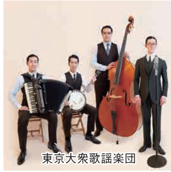
東京大衆歌謡楽団