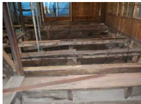
ミセ座敷2 1階 基礎砕石敷設前