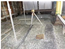
ミセ座敷1 1階 基礎砕石敷設中