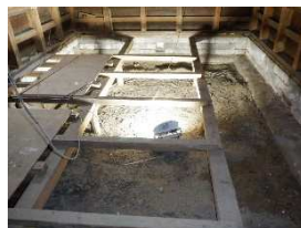
蔵 1階 床板一時取り外し中