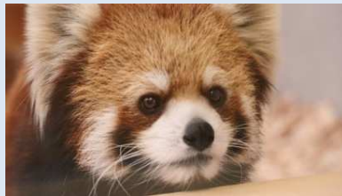
未来へはばたけ 山田製作所 桐生が岡動物園【北門】