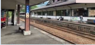
水沼駅温泉センター