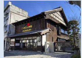
ニッポンの 神業ミュージアム (ギャラリー禅林)