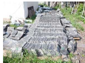
蔵 屋根 瓦降ろし再利用選別中

工事期間中は、工事車両の出入りや騒音等の発生により、ご迷惑をおかけいたしますが、みなさまのご理解、ご協力をよろしくお願いたします。