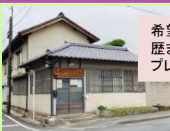
伝建まちなか交流館