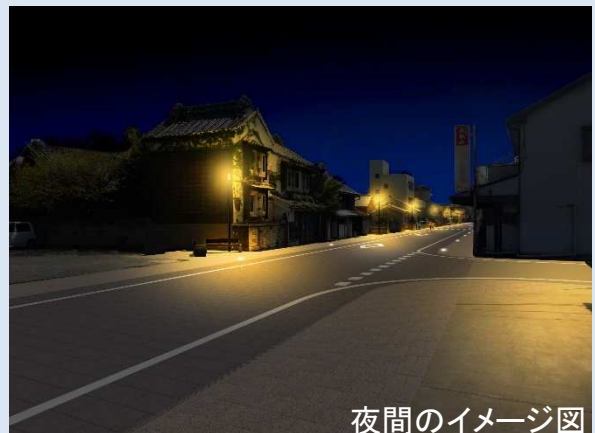
夜間のイメージ図