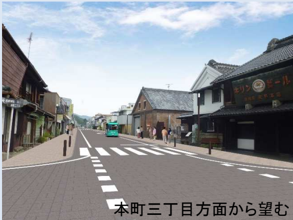
本町三丁目方面から望む

桐生土木事務所により、完成予想図が示されました。 電線地中化に向けて、整備が進んでおります。