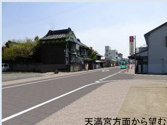
天満宮方面から望む