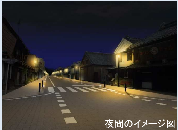
夜間のイメージ図