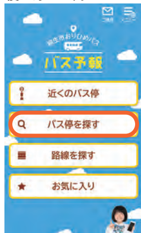
「バス停を探す」 を選ぶ