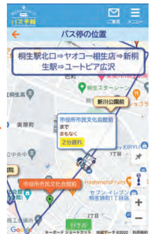
バスの位置を地図でも 確認できます