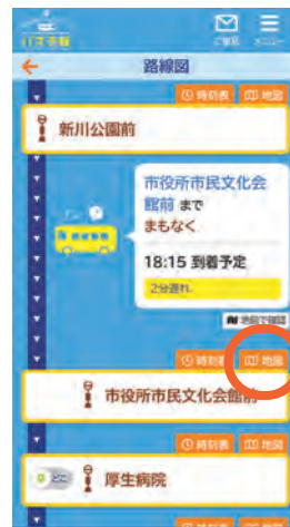
バス停イラスト右上 の「地図」を選ぶ