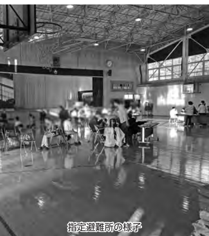
指定避難所の様子

問 明日にでも起こり得る災害への対応や災害の規模、避難の長期化など様々な要因を考慮すれば、現行の福祉避難所のみならず、福祉的ケアの観点から災害時の限られたマンパワーの効率的活用等も考慮しつつ、関係部局と連携して、現状に即した臨機応変な対応も想定しての検討を進めてまいりたい。 答 明日にでも起こり得る災害への対応や災害の規模、避難の長期化など様々な要因を考慮すれば、現行の福祉避難所のみならず、福祉的ケアの観点から災害時の限られたマンパワーの効率的活用等も考慮しつつ、関係部局と連携して、現状に即した臨機応変な対応も想定しての検討を進めてまいりたい。