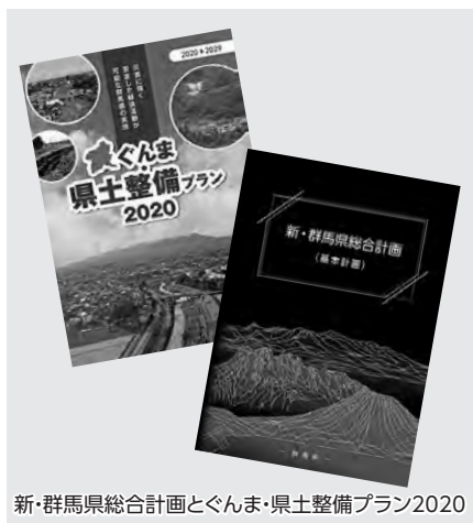
新・群馬県総合計画とぐんま・県土整備プラン2020