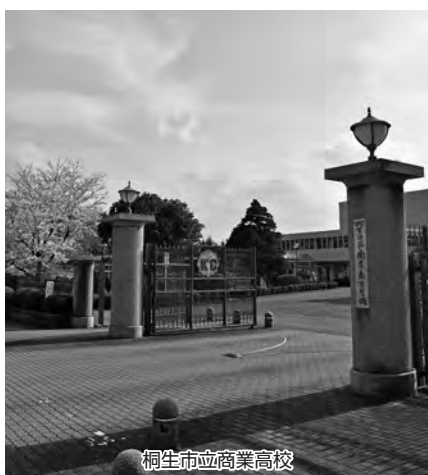
桐生市立商業高校

問 現在、より特色のある学校を目指して最適な制服のあり方について検討を始めている。モデルチェンジをする場合は生徒にアンケートを取るなどして生徒の意見を反映しながら、PTAや同窓会などと協議して決定していく予定である。