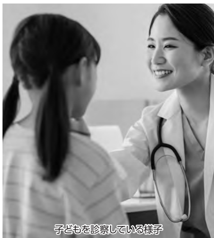
子どもを診察している様子

問 現在、県内でも18歳まで拡大している市町村があることは承知している。市の財政力等によって助成内容が異なっていることから、地域格差が生じている状況である。今後、群馬県内統一で補助対象を18歳までとして実施されるよう機会を捉えて県へ要望していきたい。 答 現在、県内でも18歳まで拡大している市町村があることは承知している。市の財政力等によって助成内容が異なっていることから、地域格差が生じている状況である。今後、群馬県内統一で補助対象を18歳までとして実施されるよう機会を捉えて県へ要望していきたい。