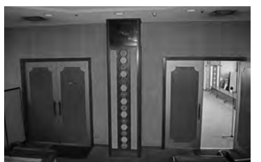
3階から見た仮議場入り口

A3 1階には桐生地域の産品を多数取り揃えている販売コーナー、2階には時間制ドリンクバーの喫茶店「じばかふえ」があります。(営業時間：午前10時～午後5時 定休日：月曜日)