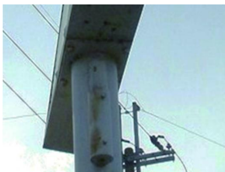
サビ（支柱・接合部）

外見はきれいで、頑丈そうに見えても、内部が腐食していることもありますので、定期的な安全点検と適切な管理を行ってください。裏面の点検項目を参考にチェックしてみましょう。また、地震の発生後や台風等の発生前後は臨時の点検を行いましょう。