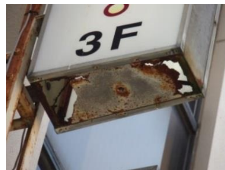
側板底部の腐食、破損