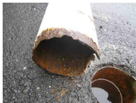
根腐りによる倒壊

早めの対応により大規模な修繕等の費用を抑制、事故を未然に防ぐことにも効果的です。