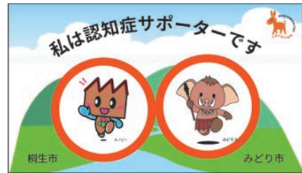
▲認知症サポーターカード（発行年度によって、カードのデザインが異なる場合があります）