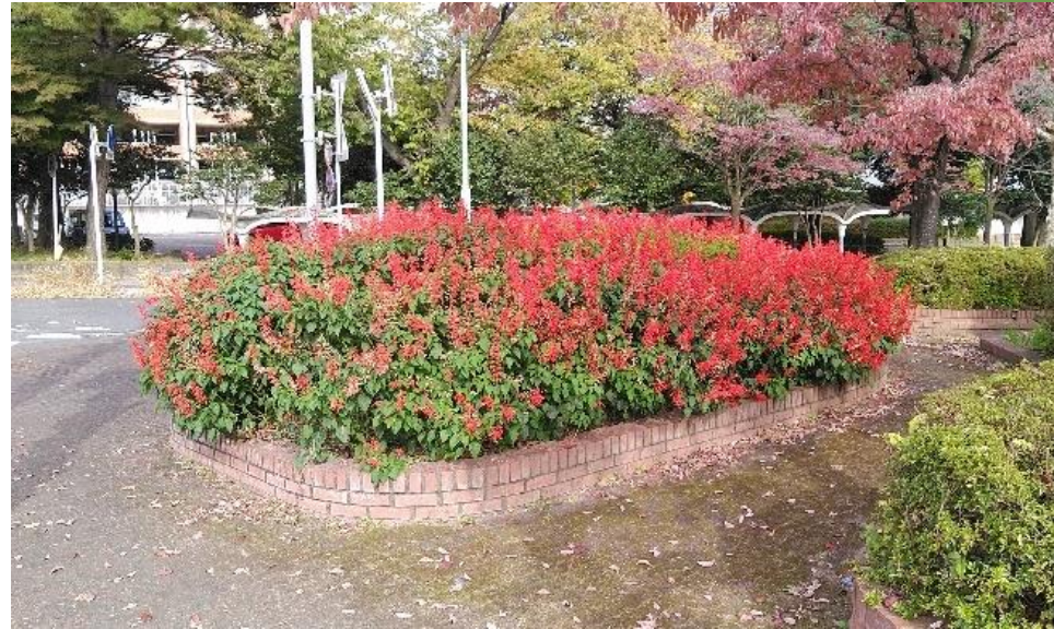
桐生市立図書館付近植栽(サルビア)の様子

桐生市内各所の風景を収めたスライドを投影し、市街地と山が隣接しているが、市街地に街路樹などの植物が少ないことについて発表しました。その後、市街地への緑化推進と共に、市の花であるサルビアの普及について提案しました。