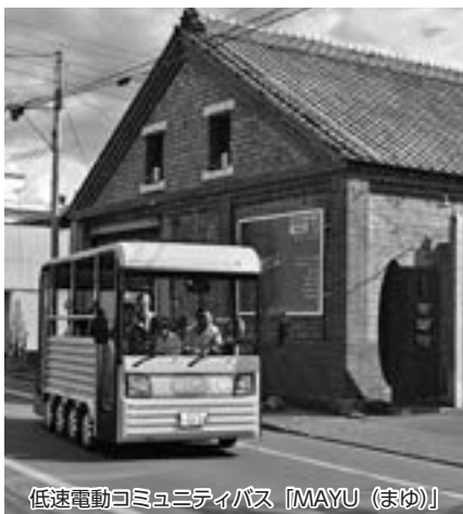
低速電動コミュニティバス「MAYU(まゆ)」

新たな計画を基に実践したい 答 持続可能な公共交通のためには、地域ごとの特性等を踏まえた交通モードへの転換を見据えた地域内交通の構築が求められる。それには、行政と地域住民との連携が重要と考える。今後、現在作成中の「(仮称) 桐生市交通ビジョン」を基に具体的に取り組んでまいりたい。