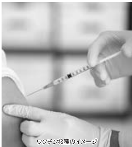
ワクチン接種のイメージ

答 現在、国でも定期接種化の検討が始まったが、全国に先駆けて助成を行うことは、HPVワクチンの男性への接種について認知を広める機会にもなると考える。インフルエンザワクチンと合わせて、各接種費用を助成することで、接種を受けやすくし、ひいては市民の健康を守るという観点から、助成実施に向け検討を指示した。