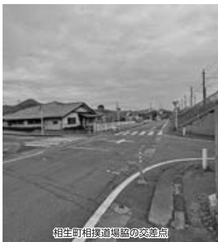
相生町相撲道場脇の交差点

問 相生町の相撲道場脇の交差点は、交通量も多くどの路線が優先か明確性に乏しく、交差点内における交通事故が多発している。交通事故の未然防止と安全安心を確保するため信号機の設置を要望するが市の見解は。