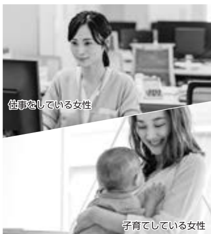
仕事をしている女性