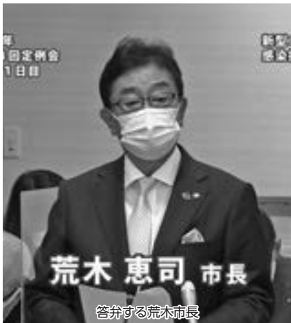
荒木 恵司 市長