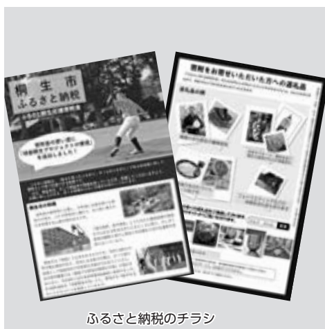
ふるさと納税のチラシ