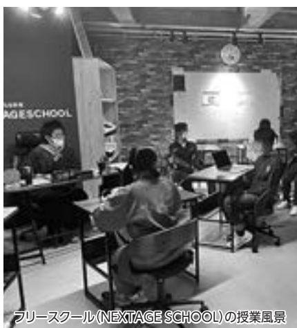
フリースクール(NEXTAGE SCHOOL)の授業風景

問 学校の教育費と二重になるのかかる民間のフリースクールで学ぶご家庭の教育費は、学校関係に係る教育費とフリースクールにかかる教育費が二重になっているが、このことの問題点について市の見解は。 負担軽減を図る対応をとっている 答 不登校のお子さんを持つ保護者にとって、お子さんがフリースクール等に通うことでその分の費用や交通費等、保護者の経済的負担が増加することは理解している。このような保護者に対し、在籍する学校の保護者負担をできるだけ軽減するため、教材費や給食費を最小限に留める対応をとっている。