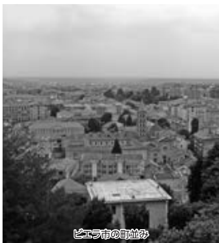
ビエラ市の町並み

問 台湾の雲林県及びイタリアのビエラ市への訪問については、それぞれの適切な時期に表敬訪問できるよう、今後適宜検討していきたい。