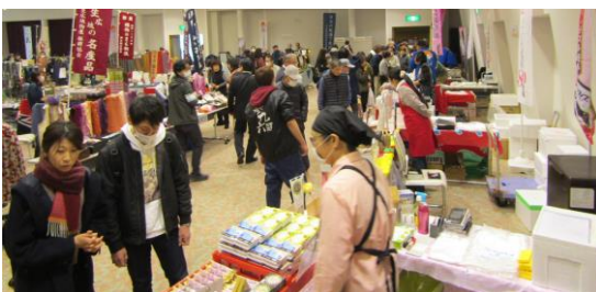
桐生市物産まつり会場風景