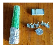
ロウソクの準備の例