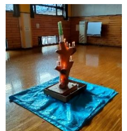
ツリー、ブルーシート