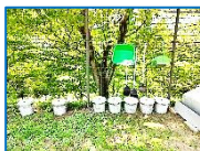
灰捨て場・掃除用具置き場