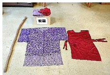
火の神衣装 (ホール)