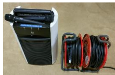
アンプ、マイク(宿泊棟ホールから借りて、持ち出す。)延長コードは倉庫にある。