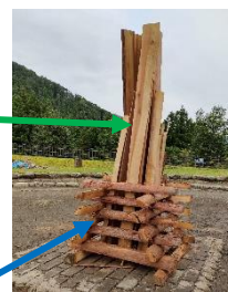
・井桁型、上のほうが狭くなるように配置する。一番下を広げすぎないとよい。