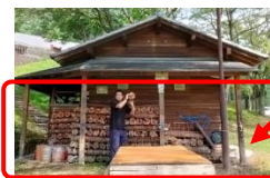
倉庫横に薪置き場がある。 ・中…5束 ・大…8束