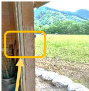
広場倉庫のコンセント