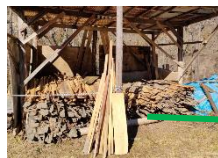
・木っ端(営火場の奥)を、縦に10~20本入れるとよい。