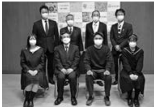
モニター会議出席者

桐生市議会では議会の活動や桐生のまちづくりなどについて、市民からのご意見・ご提言を議会運営に反映させることにより、議会機能の充実を図るため、平成30年から桐生市議会モニター制度を導入しています。