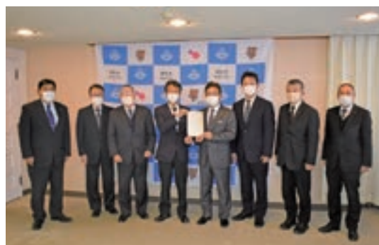
提言書を市長に渡す経済建設委員一同