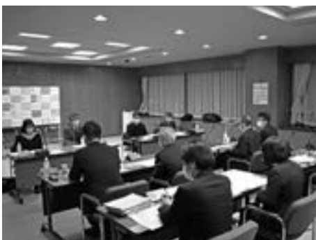
モニター会議の様子

モニターからいただく「市民目線」のご意見は、より良い桐生市議会の実現のため議会運営に反映させていきたいと思っております。