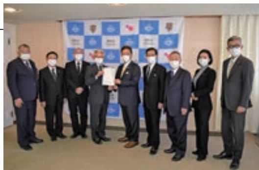
要望書を市長に渡す公共施設のあり方等調査特別委員一同