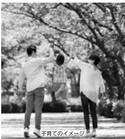
子育てのイメージ