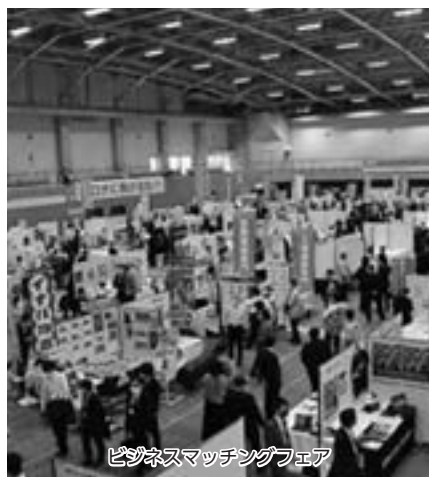
ビジネスマッチングフェア

問 企業間交流の促進及び情報発信は重要と考え、ビジネスマッチングフェアの開催や産業のまちネットワーキング推進協議会への参加、事業継続計画強化に向けた相互応援協定の締結など取り組んだ。今後も産業支援機関や金融機関等と連携し、市内製造業全般に渡り地域産業の活性化を行う。市道1-51号の交通安全対策は警察等と連携し対策を講じていく。