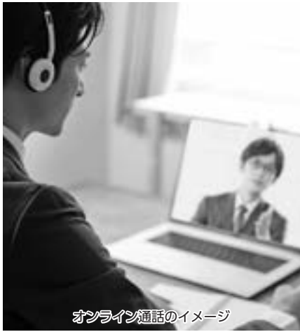
オンライン通話のイメージ

答 遠隔窓口システムは、時間と距離の問題を解決し、対面に近い状態で、離れた場所にいる職員とコミュニケーションをとることができる有効な手段であると考えます。今後の地域を越えた市民サービス提供の仕組みの構築については、提案内容や最新技術等も研究した上で、行政のデジタル化を推進してまいります。