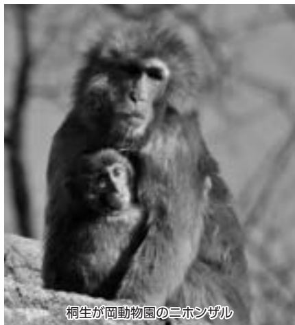
桐生が岡動物園のニホンザル