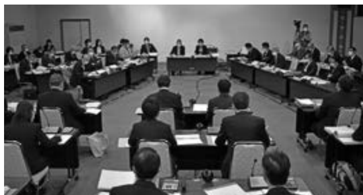
予算特別委員会の様子