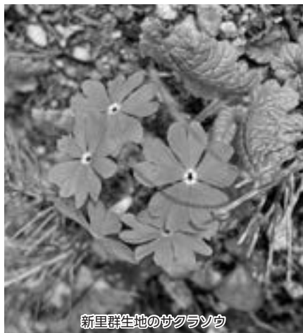
新里群生地のサクラソウ

そのほか…「梨木・香林線」「赤城山観光広域連携事業」「ポスト・コロナにおける産業経済の方向性」について質問