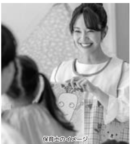
保育士のイメージ