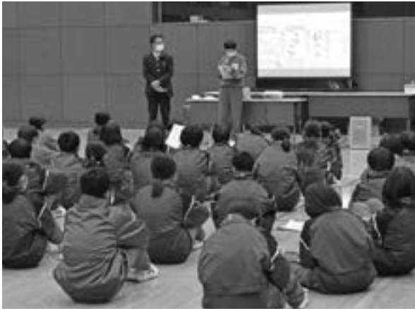
感想等をグループごとに発表する様子

令和5年1月26日(木)、新里中学校の1年生を対象に桐生市議会初の出前講座が行われました。