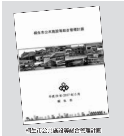
桐生市公共施設等総合管理計画

問 個別施設計画については速やかに策定しなければならぬと認識しているが、施設の複合化の検討や財政負担の平準化の観点から各施設の更新、解体、大規模修繕等の実施時期を調整する必要がある。そのためには施設全体の状況を見る中で個別施設計画の策定が必要だと考える。よって、共同4事業施設を除く個別施設計画の策定は難しいものと考えます。