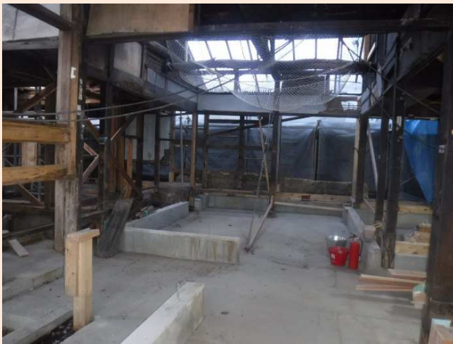
【座敷】基礎コンクリート施工済