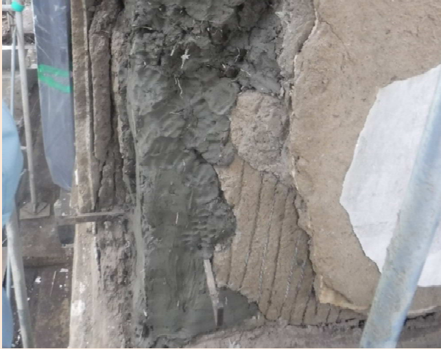
【葺】北西角荒壁施工