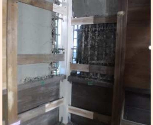
【葺】北西角隅柱取替