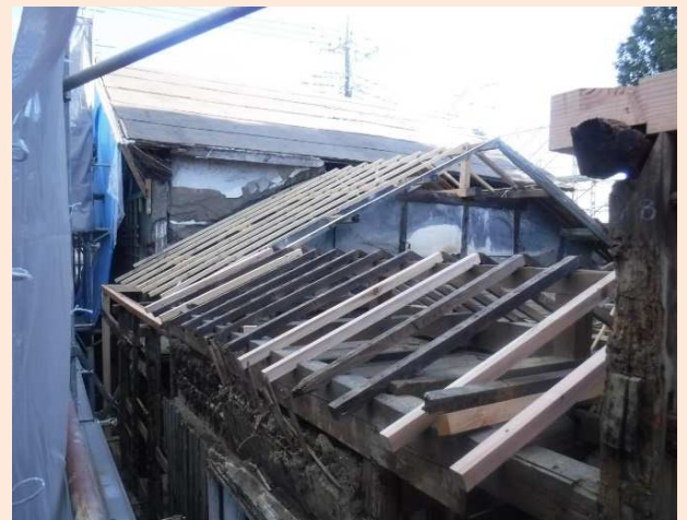
【座敷】屋根垂木一部取替

※工事期間中は、工事車両の出入りや騒音等の発生により、みなさまには、ご迷惑をおかけいたしますが、ご理解、ご協力をよろしくお願いいたします。