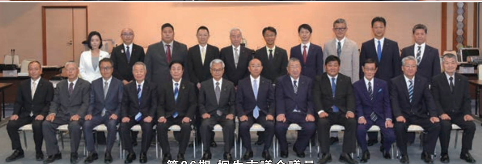
第26期 桐生市議会議員