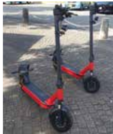
▲電動キックボード