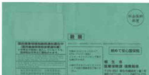
緑色の封筒で送ります

国民健康保険（国保）税は、国保の運営を支える貴重な財源です。国保加入者が病気やけがをしたときの医療費や出産育児一時金、葬祭費などの費用は、皆さんに納めていただく国保税と、国・県・市の公費などで賄われています。通知書に納付書が同封されていた場合は、納期限までに納めてください。