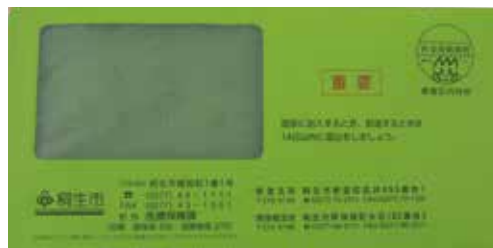
黄緑色の封筒で送ります