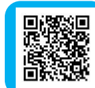
「きぬめぐり」QRコード

まずは『きぬめぐり』アプリをダウンロードしよう! ※アプリでGPSを使用するため、スポット周辺に近づくとアプリ内でスタンプが押せます。