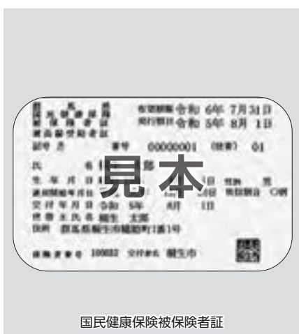
国民健康保険被保険者証

答 「行政手続法における特定の個人を識別するための番号の利用等に関する法律等の一部を改正する法律（通称「改正マイナンバー法」）が6月2日に参議院本会議で可決、成立し、同日に公布された。これを受けて同日付けで厚生労働省より各関係機関、各関係部局等において、厚生労働省関係部分の改正趣旨及び主な内容について通知が発出されている。