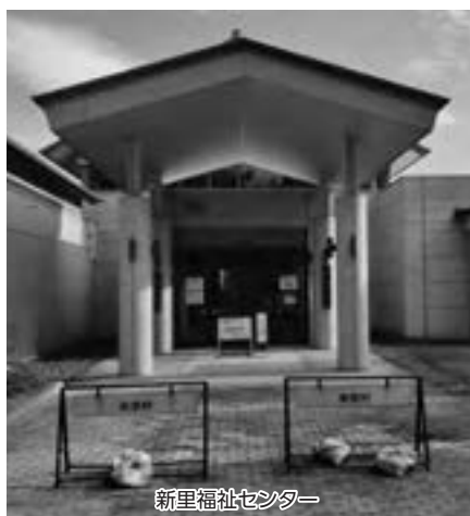
新里福祉センター

そのほか…「水害時の避難・救助に必要な技術を身につけるための研修・訓練を消防団員に向けて実施すること」について質問