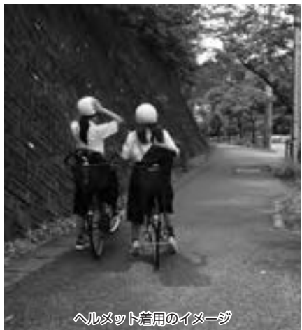
ヘルメット着用のイメージ