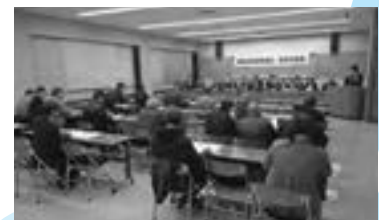
◀以前の報告会の様子