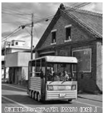
低速電動コミュニティバス「MAYU(まゆ)」