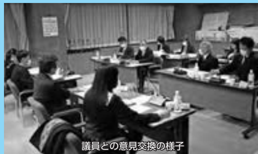
議員との意見交換の様子