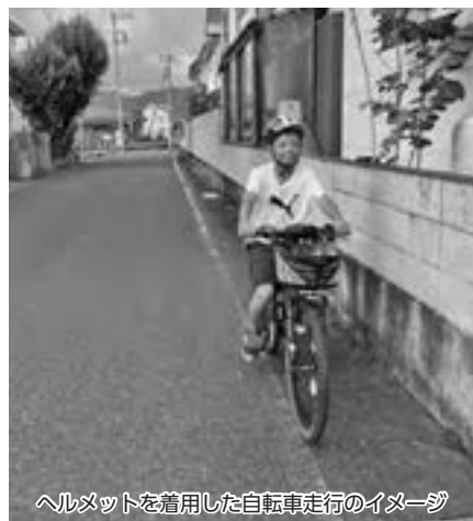
ヘルメットを着用した自転車走行のイメージ

問 他市の状況、補助の方法を検討 答 まずは、県内他市の状況を見ながら検討していきたい。また、仮に補助制度を創設する際には桐ペイポイントの付与についても検討してまいりたい。