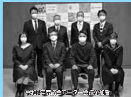
令和4年度議会モニター会議参加者