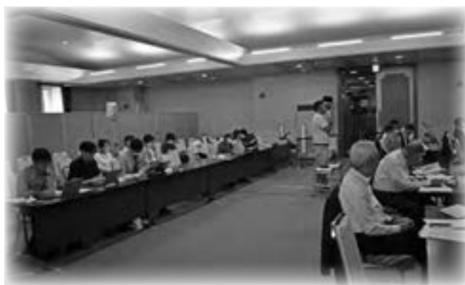
令和5年第2回定例会 傍聴席の様子

また、一般傍聴を希望される方は従前どおり、直接、仮議場(桐生地域地場産業振興センター中3階)までお越しください。