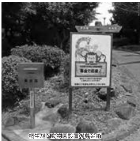
桐生が岡動物園設置の募金箱

問 令和2年度は、募金箱を設置した11月から3月末までの5か月間で21万7308円(月平均約4万3千円)、令和3年度は、91万9887円(平均約7万6千円)、令和4年度は202万6253円(月平均約16万8千円)、令和5年度は5月末現在で36万3525円(平均約18万1千円)となっており、令和2年11月から令和5年5月までの2年7か月の総額は363万7628円となっている。