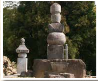
▲由良成繁の墓（鳳仙寺）