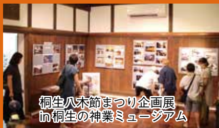
桐生八木節まつり企画展 in 桐生の神業ミュージアム