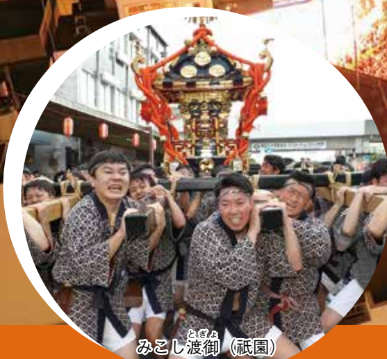
とぎん みこし渡御 (祇園)

4年ぶりに全面開催され、8月4日(金)から6日(日)までの3日間に、約50万人が来場しました。