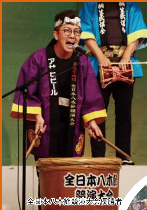
全日本八木節競演大会優勝者