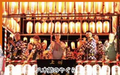
上州 八木節のやぐら