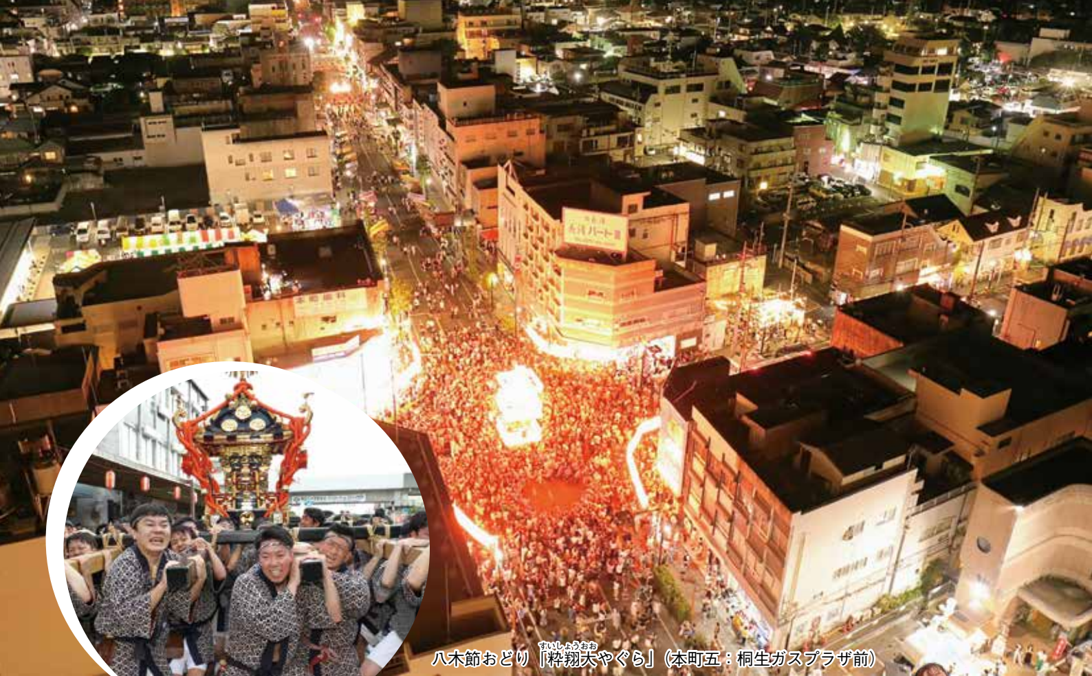
八木節おどり「 すいしろうお 粹翔夫やぐら」(本町五：桐生ガスプラザ前)