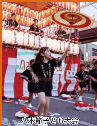
八木節子ども大会