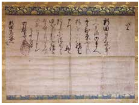
▲前田利家書状（金谷文書） 1行目「新田御身上」は由良国繁の身上を指します。