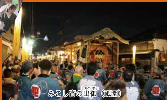
みこし宵の出御 (祇園)