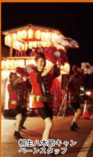
桐生八木節キャン ペーンスタッフ