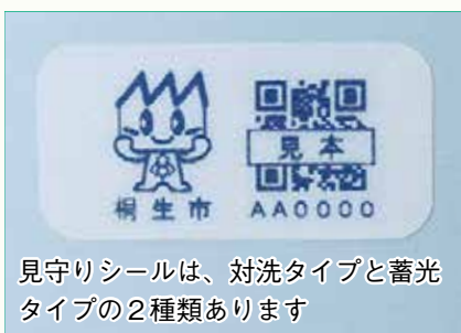
見守りシールは、対洗タイプと蓄光タイプの2種類あります

元コードをスマートフォンなどのカメラで読み取ると、伝言板が表示され、読み取り通知が家族などに届きます。個人情報を開示することなく、発見者と家族が情報交換でき、警察などの関係者に保護してもらうことができます。見守りシールは、初回のみ無料で30枚を交付します。対象は徘徊のおそれのある高齢者の家族など。申し込みは申請書を直接、健康長寿課(市役所1階)へ。申請用紙は同課と新里・黒保根支所市民生活課、市ホームページにあります。