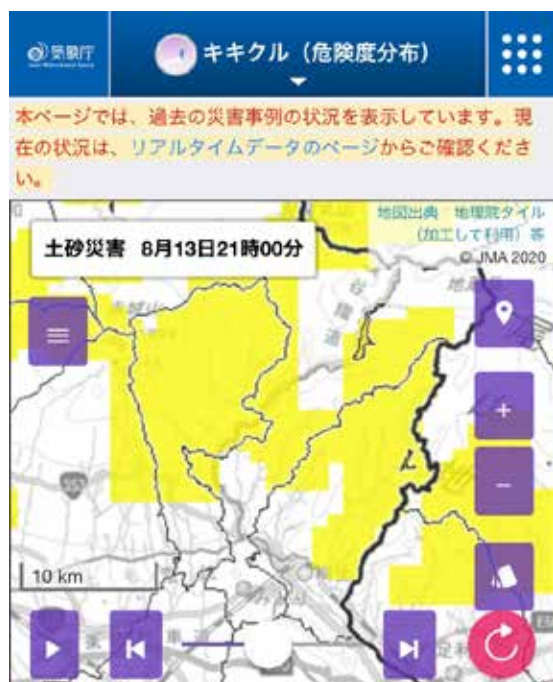
キキクル（スマホ表示画面）