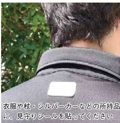
衣服や杖・シルバーカーなどの所持品に、見守りシールを貼ってください