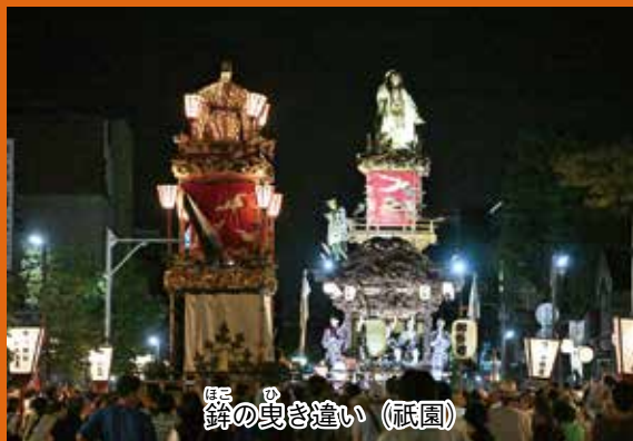
鉾の曳き違い (祇園)