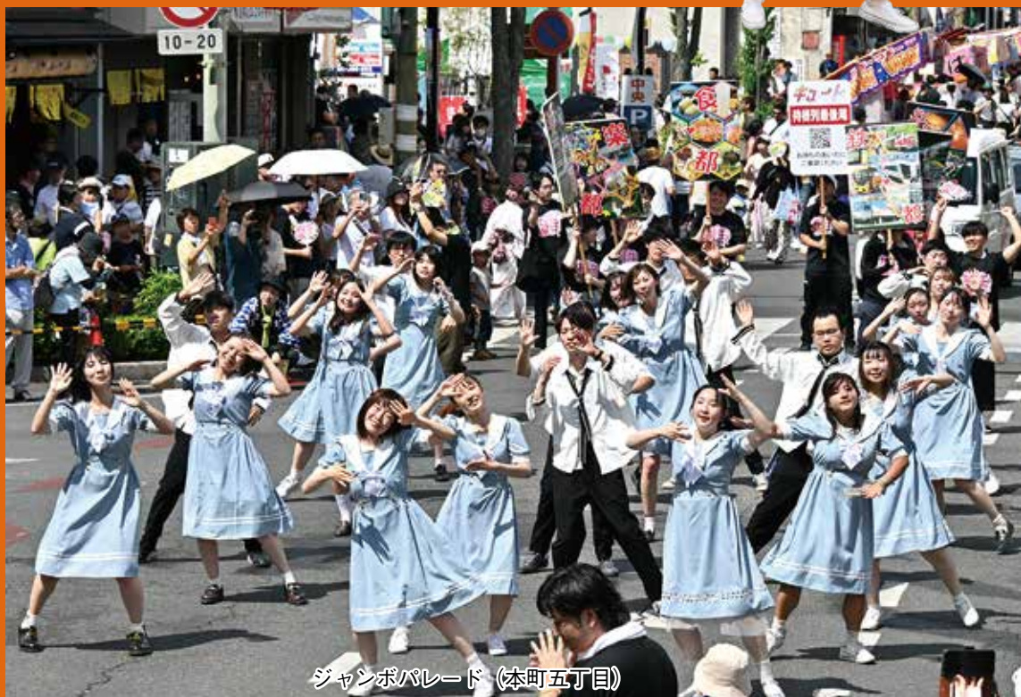
ジャンボパレード (本町五丁目)