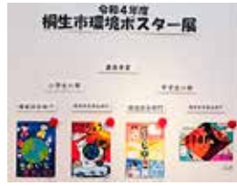
昨年度の受賞作品