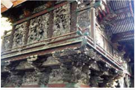
▲桐生天満宮本殿北西側の彫刻

令和5年6月23日付けの新聞各紙は、「国の文化審議会が、江戸時代後期の北関東神社建築を象徴する桐生天満宮を国の重要文化財に指定するよう文部科学大臣に答申した」と報じました。対象は、寛政年間から享和年間（1789～1804年）に建造された本殿・幣殿・拝殿が連なる