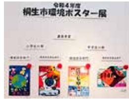
昨年度の受賞作品

場所 ヤオコーマーケットシティ桐生相生店 内容 空き家や不動産全般に関する悩み事の無料相談、不動産物件の資料展示