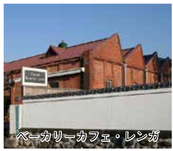
ベーカリーカフェ・レンガ