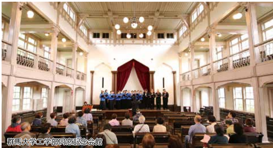
群馬大学工学部同窓記念会館