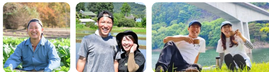
地域コーディネーター