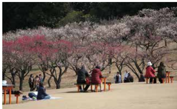
▲春の訪れとともに園内に梅の花が咲き誇ります