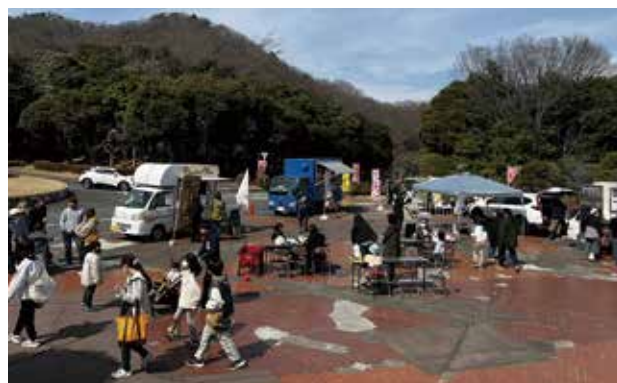
▲梅まつり開催期間中は、キッチンカーで飲食店などが出店します