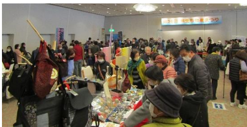
桐生市物産まつり会場風景