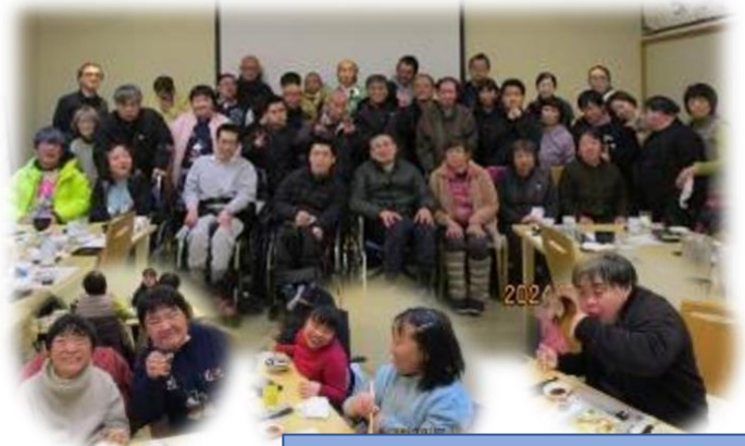
R5年度新年会：美喜仁館にて

〒376-0041 桐生市川内町5-1199 TEL 0277-65-6666 FAX 0277-65-6640 MAIL kiryu-miyamaen@bz01.plala.or.jp ホームページ https://kiryu-csw.net/