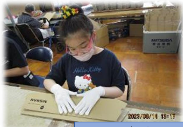
作業風景：ダンボール折り

・段ボール作業（ワイパーブレードの入る箱の組立） ・しいたけ栽培作業（菌床栽培） ・ボールペン組立て作業 ・カレンダー製作作業 ・エバーパッキン作業（緩衝材袋入） ・ギフトの作成（コーヒーの箱詰） 利用者さんは、”社会の一員として誇りを持って”取り組んでいます。作業工賃が毎月支給されます。