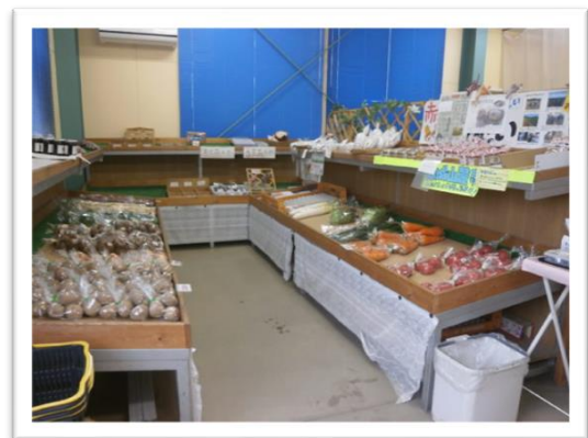
店舗内：直売コーナー