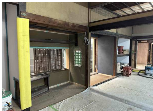
【座敷・奥座敷】北側内部状況