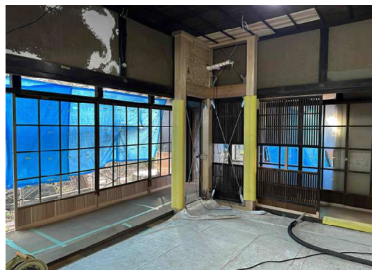
【座敷】南側内部状況