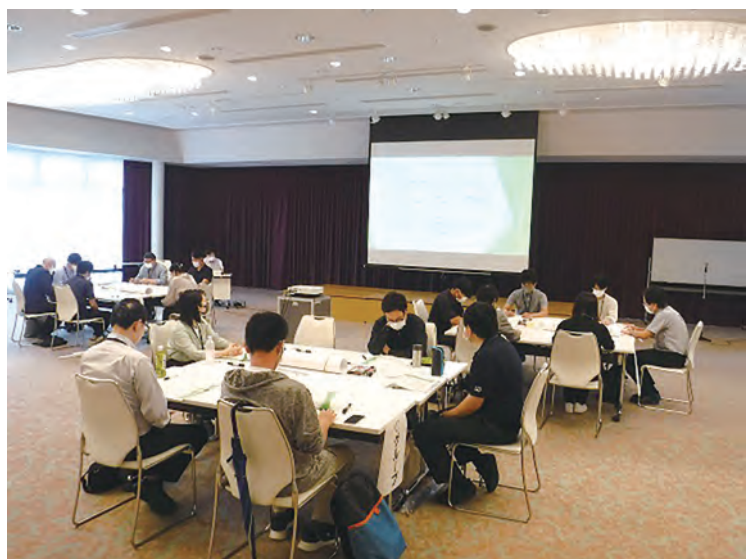
若者ワークショップの様子