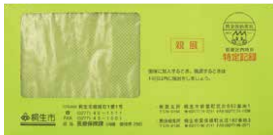
黄緑色の封筒で送ります

国民健康保険税（国保税）は、国民健康保険（国保）の運営を支える貴重な財源です。国保加入者が病気やけがをしたときの医療費や出産育児一時金、葬祭費などの費用は、皆さんに納めていただく国保税と、国・県・市の公費などで賄われています。