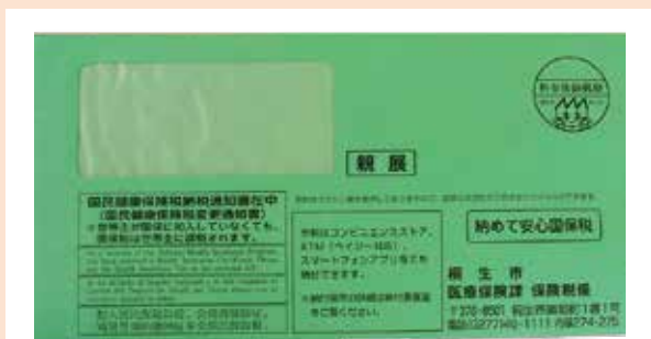
緑色の封筒で送ります