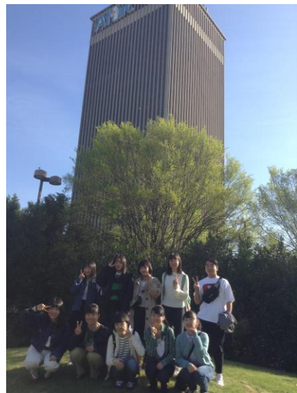
アフラック本社訪問