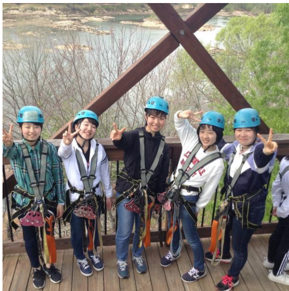
ダウントウン周辺にてジップライン体験