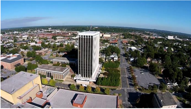
【市中心部の街並み】