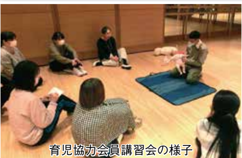
育児協力会員講習会の様子