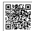
◀定額減税 特設サイト