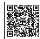
◀年末調整が よくわかる ページ