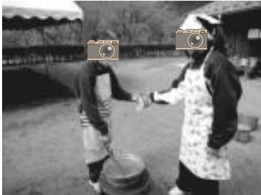
【カレーのルー投入！】