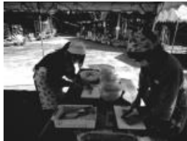
【準備も手際よくできました】