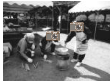
【かまどは火加減が難しい】