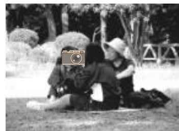
【水道山でのんびり】