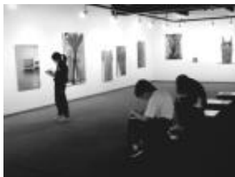
【真剣にスケッチ中】

当日は、桐生を拠点に活動している写真家「石内 都」さんの特別展が開催中でした。子どもたちは、静かな環境の中でじっくりと作品を鑑賞したり、気に入った作品をスケッチしたりしました。鑑賞後は、水道山公園でお昼を食べ、松ぼっくりやどんぐりを拾い、秋空のもとゆっくりとした時間を過ごしました。