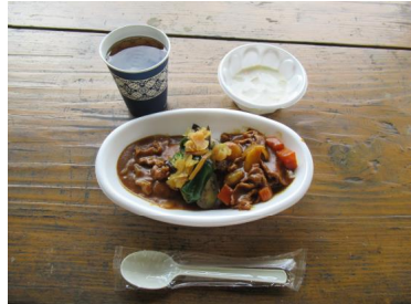
【美味しいカレーが完成】