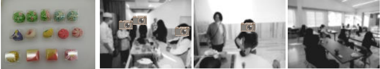
【季節を感じるものばかりです】【お茶の作法も教えてもらい、おいしくいただきました】